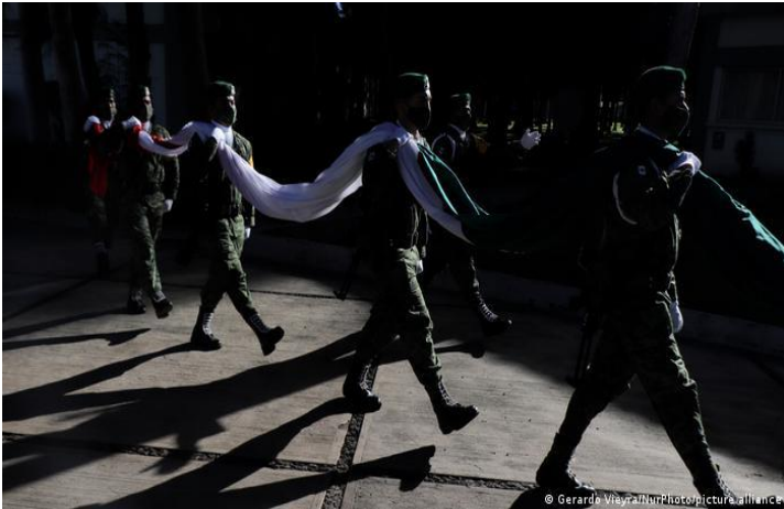
Desfile del Ejército mexicano (SEDENA) en Ciudad de México.

A través del decreto, AMLO ordenó que todos los proyectos de su gobierno sean considerados de Seguridad Nacional . Con eso los hace intocables, inamovibles e inescrutables. Violentando la ley que regula aquello que puede ser considerado de Seguridad Nacional, el Presidente pretende: imponer sus obras con el pretexto de que son esenciales, no importando si estas no cuentan con el consenso ciudadano, no importando si son innecesarias, inviables o de costos excesivos, y sin que deban cumplir con las normas ambientales o de uso de suelo.